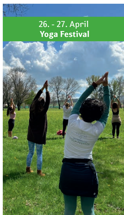
26. - 27. April Yoga Festival