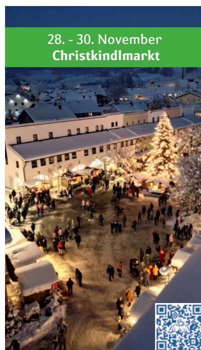
28. - 30. November Christkindlmarkt