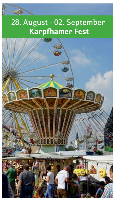
28. August - 02. September Karpfhamer Fest