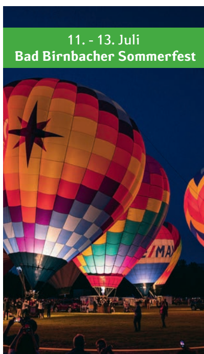
11. - 13. Juli Bad Birnbacher Sommerfest